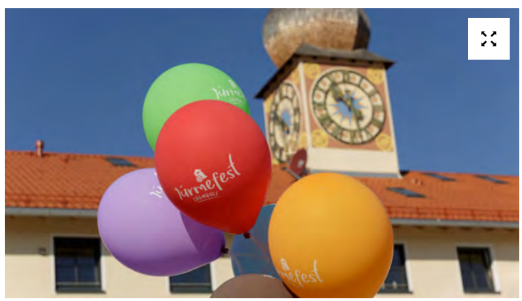
Zahlreiche Besucher kamen zum zweiten "Türmefest" nach Brannenburg.

Brannenburg - Das zweite "Türmefest" des Generationenwohnprojektes "Dahoam im Inntal" war ein voller Erfolg. Rund 5.000 Besucher feierten am 29. und 30. September gemeinsam.