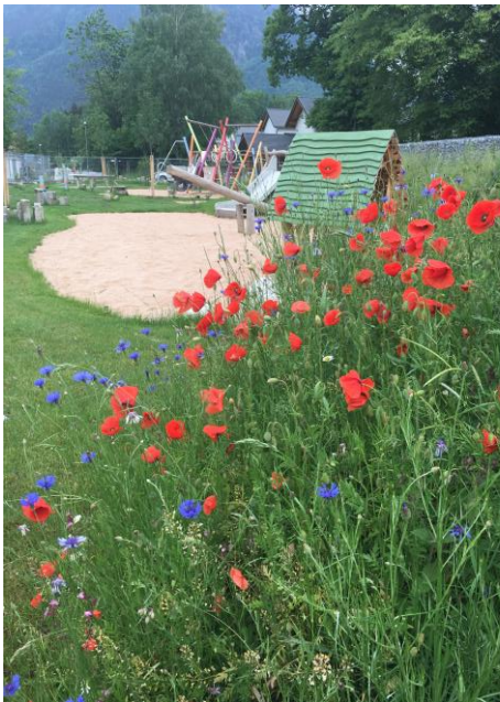
Unser Spielplatz ist bespielbar!