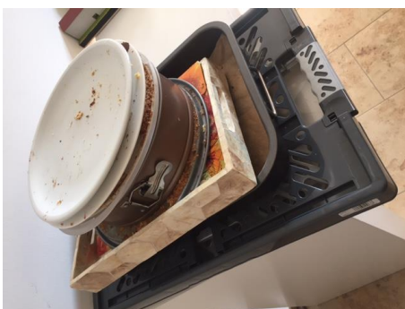
Verwaiste Kuchenformen zur Abholung bereit!