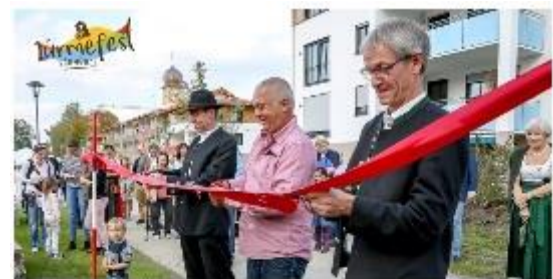
Am 24. September 2017 fand auf dem Gelände von DAHOAM im INNTAL das erste Türmefest mit buntem Programm für alle Generationen statt.