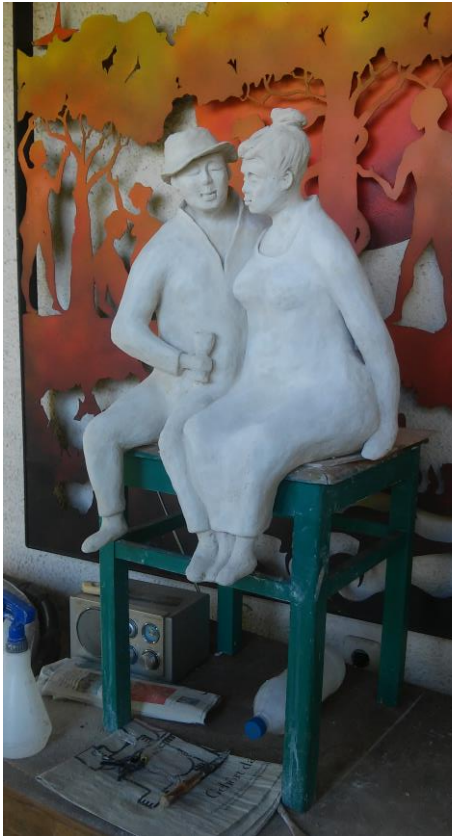
Kunstwerk „Bankerlsitzer“ in Vorstufe